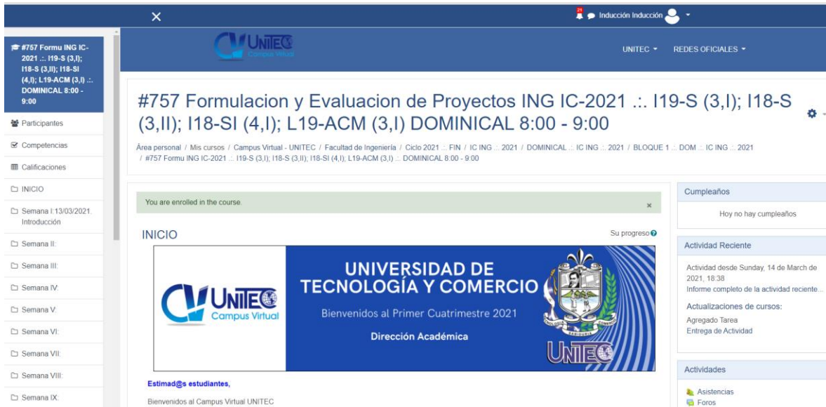
Ilustración 6: Ingresa a tu aula virtual y comprueba las actividades de tu clase.

Si por error activaste un aula virtual que no corresponde a tu hoja de inscripción de clases y el horario inscrito, puedes darte de baja en la siguiente opción.