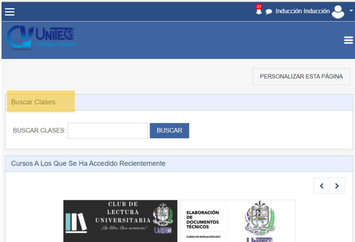
Ilustración 2: Área Personal - Perfil del Usuario

Al ingresar en el área personal, usted encontrará una barra de herramienta para poder buscar su clase: