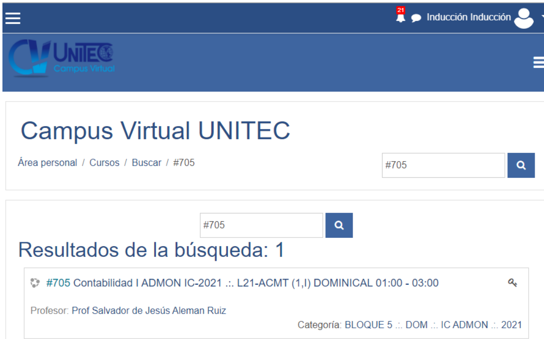
Ilustración 3: Ejemplo 1 - Búsqueda con #ID