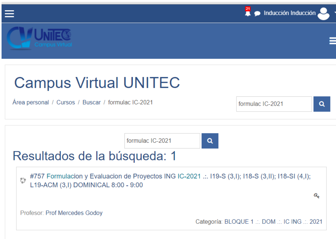
Ilustración 4: Ejemplo 2 - Realizando búsqueda de la clase de Formulación y Evaluación de Proyectos